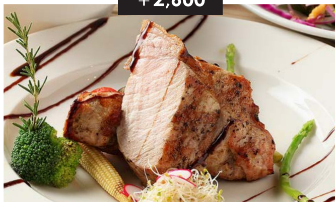
愛知県産豚のグリルドポーク (200g) grilled pork