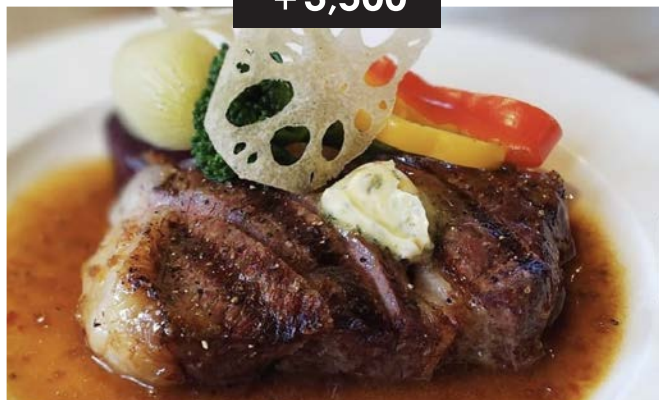
知多牛ランプステーキ (225g) CHITA beef rump steak