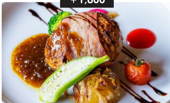
ケイジャン風味のハンバーグ (180g) cajun style hamburger steak